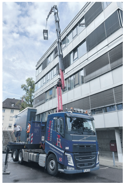
Der Autokran hievt das Gerüst aufs Dach vom HfWU-Gebäude.

Darüber hinaus bauen die IT-Experten der Stadtverwaltung derzeit ein zentrales Rechenzentrum im Rathaus auf, an das die Schulen angeschlossen werden. Denn nach der Beteiligung des Schulbeirats hatte der Gemeinderat in seiner Sitzung am 28. Juni 2022 zusätzlich die Zentralisierung der Verwaltungsnetze und des Webhostings beschlossen.