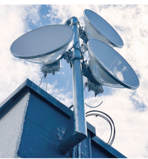
Die neuen Richtfunkantennen auf dem HfWU-Gebäude in der Parkstraße.

Sie sehen ganz unscheinbar aus und doch stellen sie einen Quantensprung in Sachen Internetverbindung dar: die neuen Richtfunkantennen an den Geislinger Schulen sowie auf dem Dach der Hochschule für Wirtschaft und Umwelt (HfWU) in der Parkstraße.