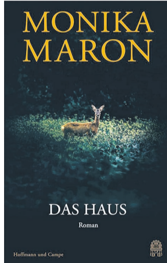
Monika Maron: Das Haus