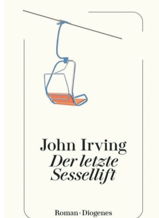
John Irving: Der letzte Sessellift

Freitag, 15. 3. 18.30 bis 21.00 Uhr Veranstalter: Stadtbücherei + Geislinger LiteraturNetzwerk e.V. Ort: Lesecafe der Stadtbücherei Geislingen Die Interessierten treffen sich am Freitag, 15.03.2024 um 18.30 Uhr im Lesecafe der Stadtbücherei.