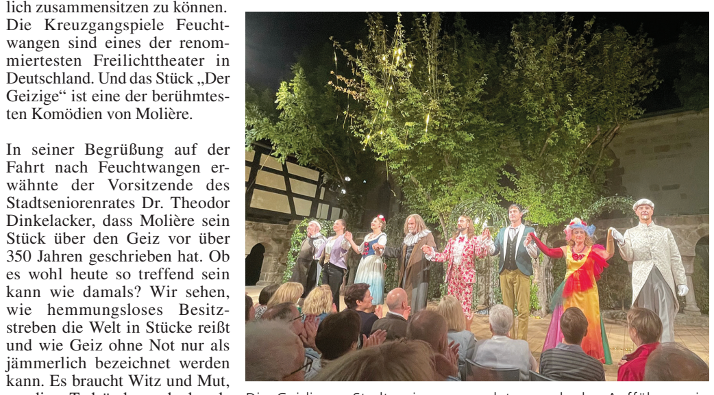
Die Geislinger Stadtsenioren spendeten nach der Aufführung in Ellwangen viel Beifall.