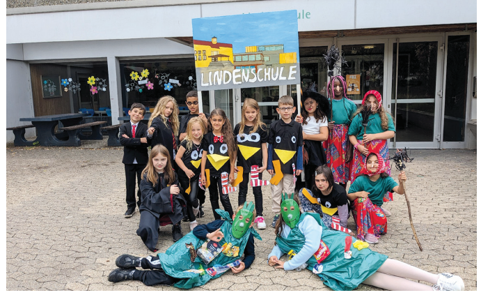
Auch die Kinder der Lindenschule haben sich sehr über ihre Platzierung gefreut.