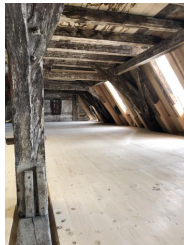
Alter Zoll 4

Links + rechts: Holz ausbesserungsarbeiten im Dachstuhl