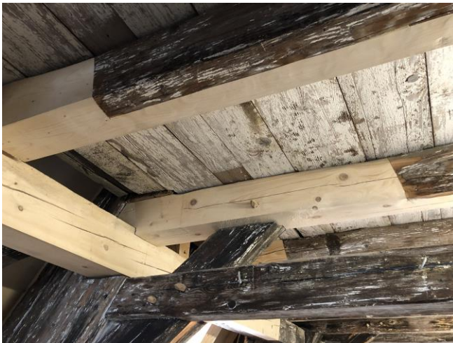
Alter Zoll 3

Im Übrigen liegt die Sanierung des Alten Zolls voll im Zeit- und Kostenplan.