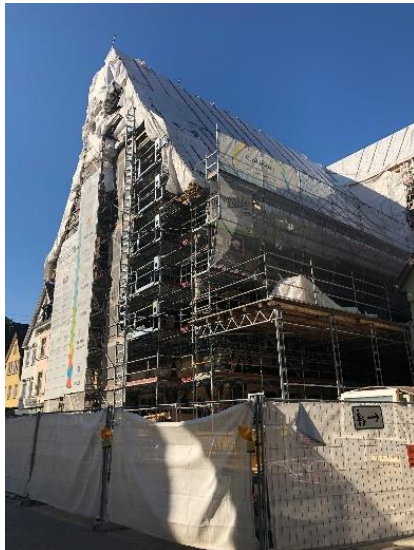
Alter Zoll 1