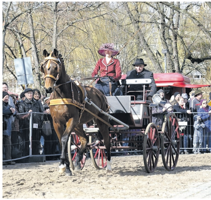
Beim Geislinger Pferdemarkt werden die schönsten Pferde und Gespanne prämiert.

den Linden in 73312 Geislingen an der Steige Parken: Parkplätze gibt es unter anderem am Berufsschulzentrum, am 5-Täler-Bad, an der Michelberghalle, an der Tälesbahnstraße und entlang der Oberböhringer Straße. Der Eintritt zum Pferdemarkt ist frei.